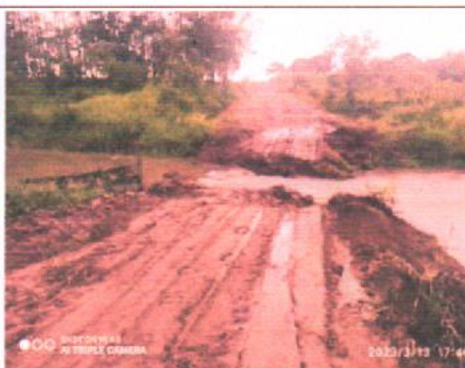
Figura 04: Local do empreendimento.