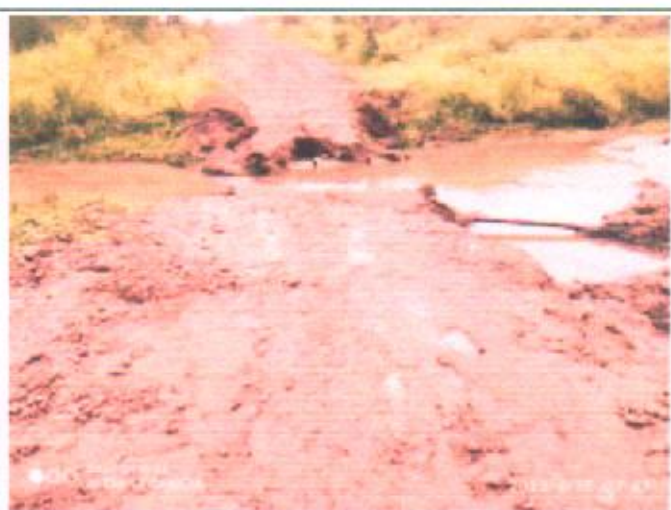
Figura 02: Local do empreendimento.