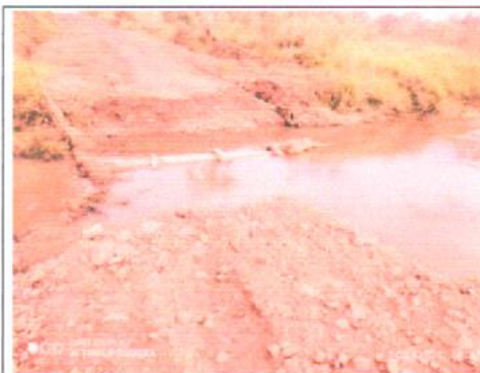
Figura 03: Local do empreendimento.